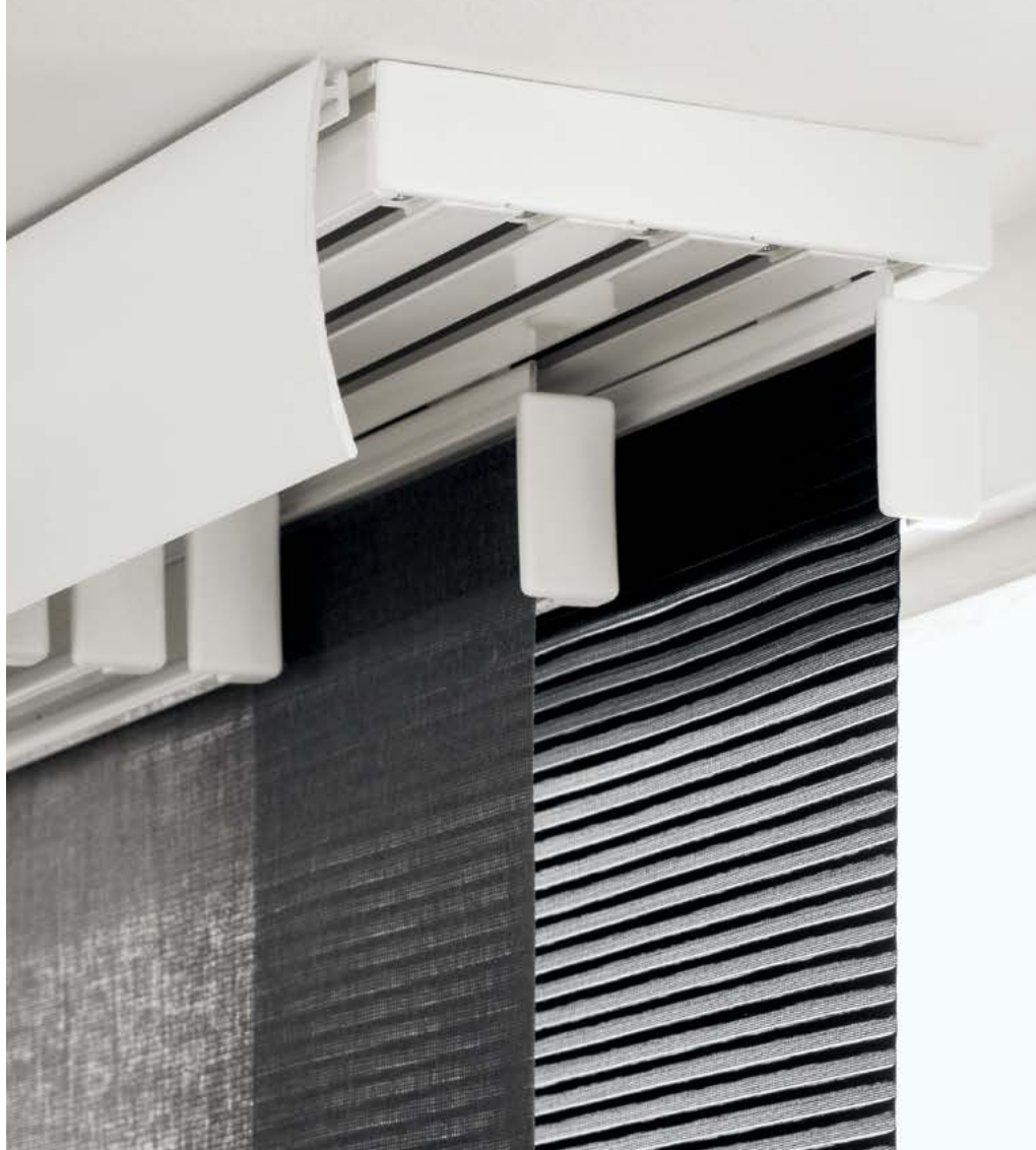
Photo avec l'option rail embellisseur