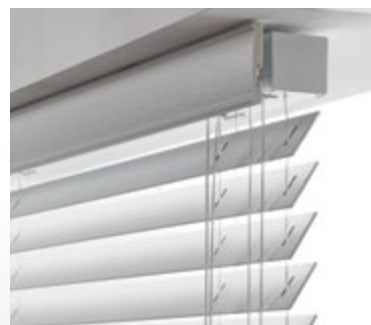
Bambou col. blanc / A gauche : finition manoeuvre Et glands - option guidage acier / A droite : finition cantonnière : bandeau seul