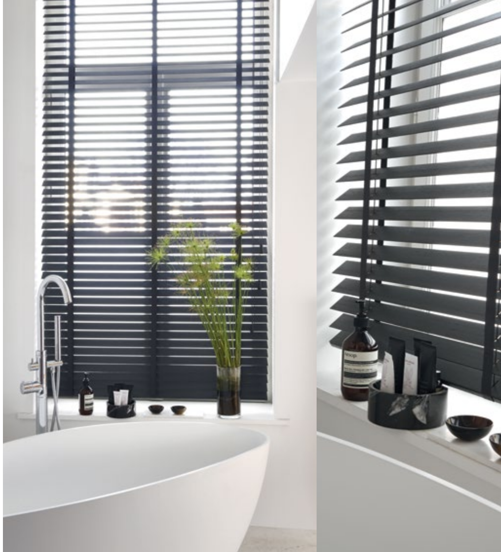
Bambou col. Anthracite 50mm avec galon