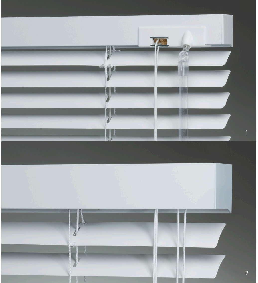
1 - Boitier pour lames 16, 25 Et 35 mm 2 - Boitier pour lames 50 Et 70 mm